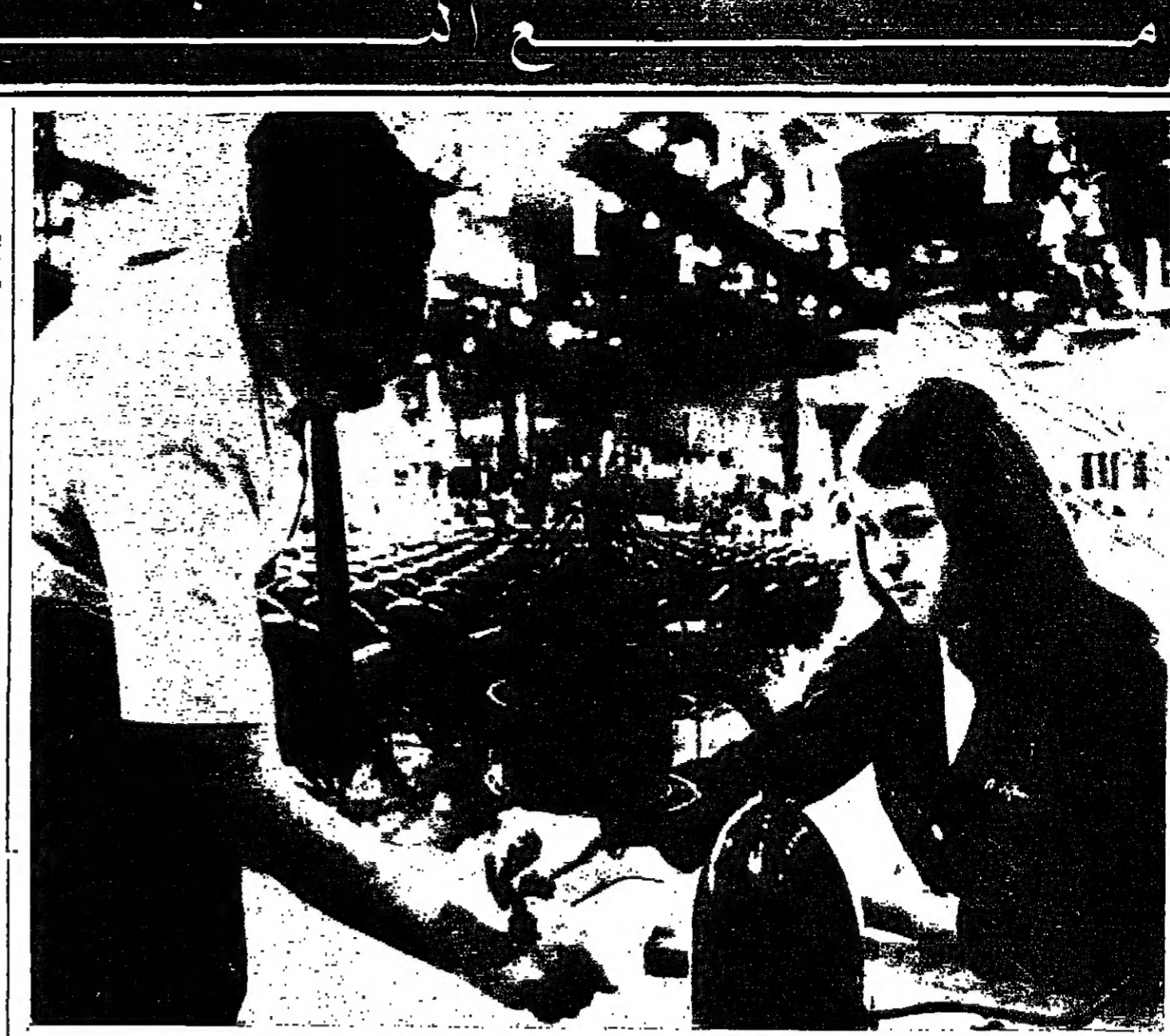
مجازرة في الجزائر... مجازرة في الجزائر التي تتبع لسي انتخبات مرشح الحزب الجمهوري لرئاسة الجمهورية طبع خاتم معين على يدى المشتركين في مؤتمر الحزب... حيث جرى التوقيع في الخاتم قبيل السماح للمشترك بخروج قاعة المؤتمر... وفي الصورة غانة من تسم الان تطعيد احد المشتركين في المؤتمر الصورة... للرئيس بن بوعزيز.